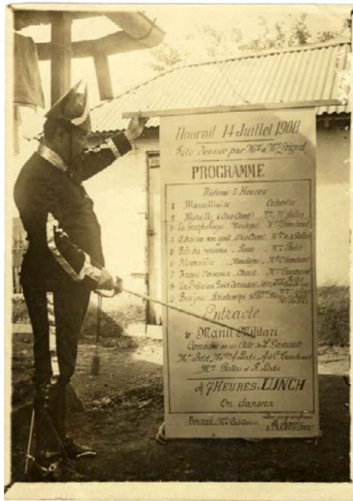
Programme du 14 juillet 1908 à Bourail, Nouvelle-Calédonie.

Malgré la pesanteur oppressive du contexte colonial, la fête fait aussi partie de la vie. Les fêtes « indigènes », coutumières ou communautaires sont sous le contrôle des autorités coloniales tandis que sont encouragées les fêtes religieuses, agricoles ou républicaines, autant d'occasion de cultiver l'entre soi ou de permettre la mixité, les croisements ou les rencontres.