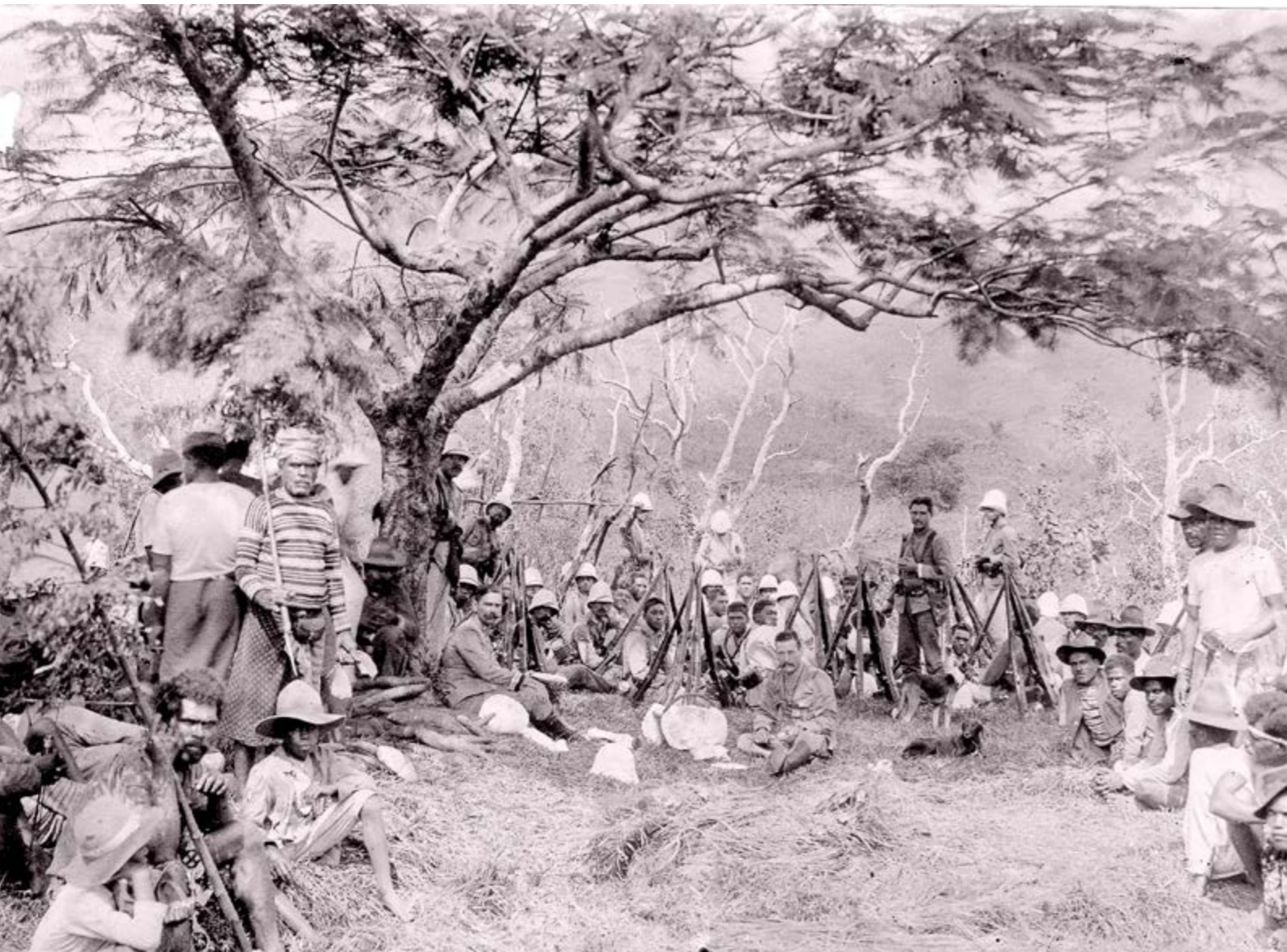
Auxiliaires kanak en soutien aux militaires français pendant l'insurrection de 1917 qu'il est plus juste d'appeler la guerre de 1917, région nord, Nouvelle-Calédonie.

© Archives de Nouvelle-Calédonie, 2 Num 9-374.