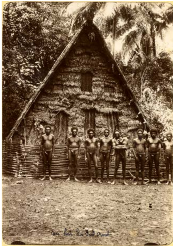
Maison des hommes de la baie du sud-ouest, Malakula, Vanuatu. ©Archives de Nouvelle-Calédonie, 198Fi069.

Des maisons traditionnelles kanak et ni-vanuatu, à la maison à deux étages d'un colon prospère en passant par les petites maisons en torchis pour les condamnés du bagne ou pour les « petits colons » ou les baraquements pour les engagés d'origine asiatique aux sommets des massifs miniers calédoniens ou sur les plantations au Vanuatu, les formes d'habitats témoignent de mondes sociaux différenciés, voire ségrégués.