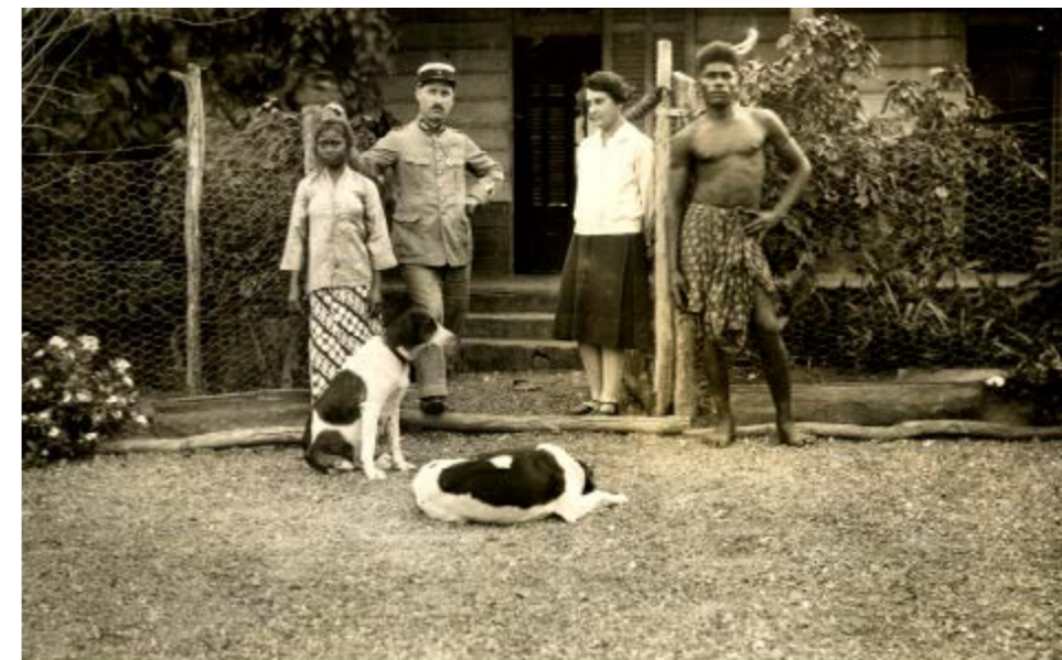
Un gendarme et sa femme avec leurs domestiques, Nouvelle-Calédonie. Autour de 1930 ©Archives de Nouvelle-Calédonie, 148Fi13-65.

Au cœur de tout projet colonial, il y a la volonté de « surveiller et punir » les peuples conquis voués à devenir colonisés et qu'il convient de « contrôler ». La France utilisa le régime de l'indigénat dans l'ensemble de ses colonies (à quelques rares exceptions près) appliqué sous des formes particulières selon les contextes jusqu'en 1946. Le régime de l'indigénat fut mis en œuvre en Nouvelle-Calédonie à partir de 1887 d'une façon redoutablement efficace, avec comme partout, l'implication des chefs comme intermédiaires. Il ne fut, en revanche, que très partiellement appliqué au Vanuatu sur des populations qui échappaient largement à l'emprise de l'Etat. Au régime de l'indigénat, s'ajoute en Nouvelle-Calédonie, la présence du bagne et le contrôle qu'exerce l'institution pénitentiaire sur les condamnés, ex-condamnés et colons pénaux, qui constituent jusqu'aux années 1920, plus de la moitié de la population « blanche » présente sur le territoire. La pesanteur de la surveillance et l'appréhension de la punition conditionnent l'existence des Kanak, travailleurs engagés et familles de condamnés sous la période coloniale en contraste avec la situation au Vanuatu où la présence de l'Etat et de ses agents est beaucoup plus labile.