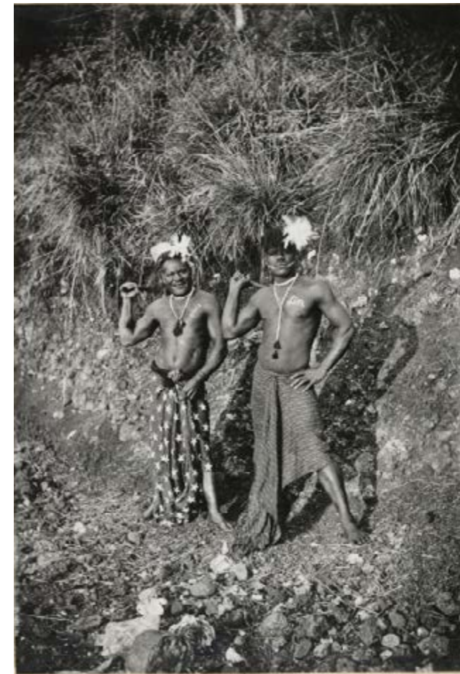
La mode du manou, Nouvelle-Calédonie, c. 1889-1919.

Couvrir les corps fut un enjeu colonial surtout dans des îles où s’habiller prend une toute autre forme. L’habillement fait partie de la mission civilisatrice mais il constitue aussi un instrument d’affirmation identitaire, de résistance et de distinction. Les photos présentées illustrent l’extrême variété des façons et des possibilités de se couvrir dans un contexte où se côtoient condamnés, riches et pauvres colons, insulaires, engagés « tonkinois » (vietnamiens), javanais ou autres.