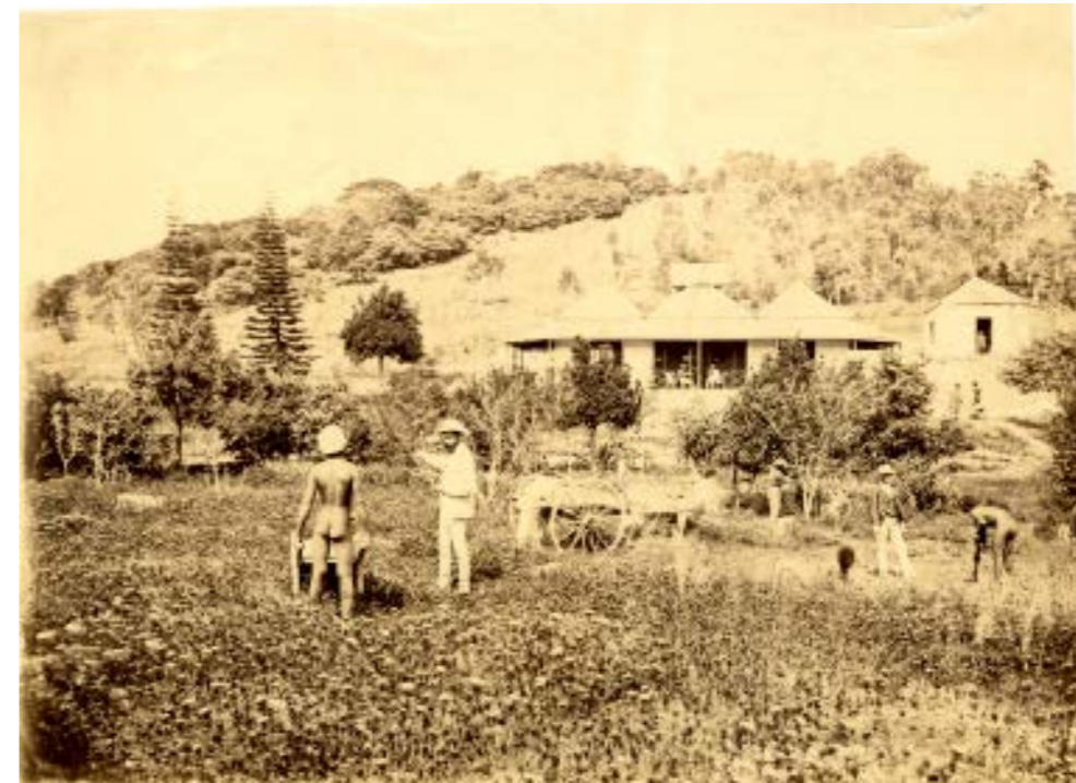
La propriété Clavel à Port Despointes, Nouvelle-Calédonie, 1874.

Le travail est une valeur centrale du projet colonial, élevé au rang de levier moralisateur ou civilisationnel. La « mise au travail » des Kanak et des Ni-Vanuatu ainsi que l'exploitation des travailleurs importés est un objectif constamment réaffirmé dont la photographie témoigne dans de multiples situations. Mais le travail est aussi vanté pour ses vertus rédemptrices pour les condamnés envoyés en Nouvelle-Calédonie tout autant qu'il constitue un pilier moral pour les familles de colons libres pour qui il faut travailler autant que faire travailler.