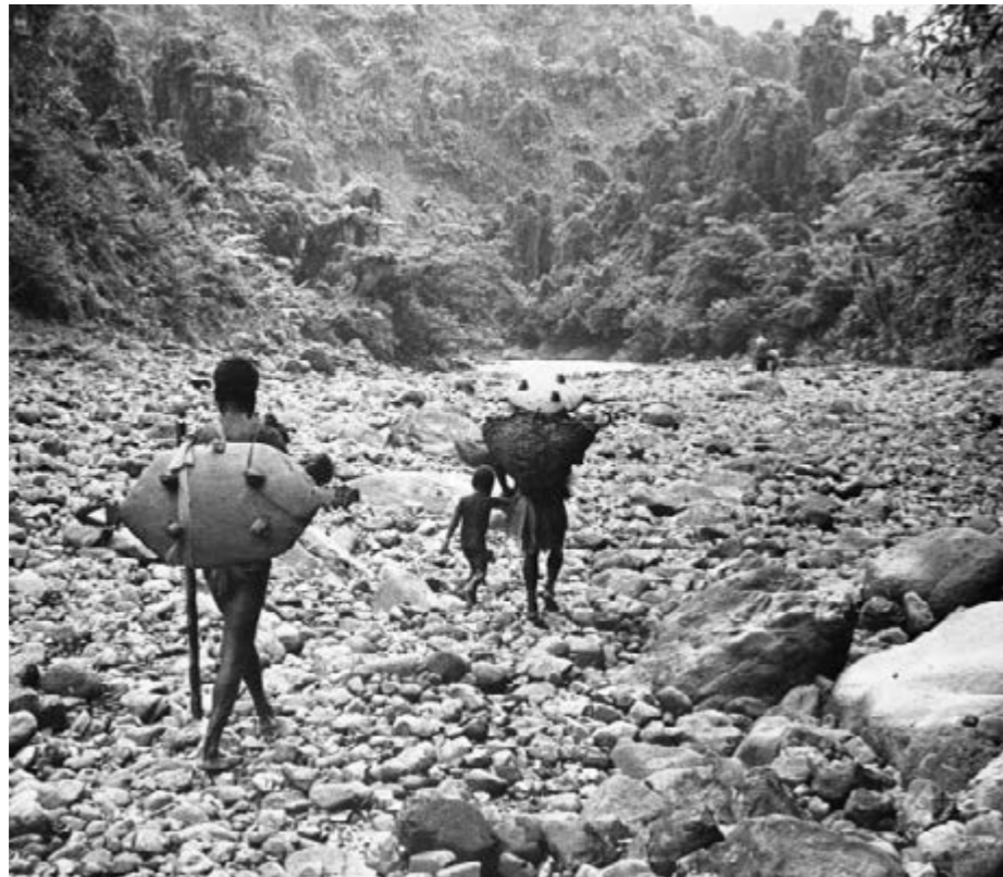
Ni-Vanuatu circulant dans le lit d'une rivière sur l'île Espiritu Santo, 1900-1910

Kanak et Ni-Vanuatu circulaient aisément sur les sentiers, dans les montagnes ou dans les plaines, et naviguaient le long des côtes sur des pirogues dans le lagon jusqu'en en haute mer. Pour les Européens, les déplacements par la mer furent longtemps les plus faciles par cabotage pour atteindre les centres de colonisation le long des côtes. En revanche, la circulation par voie de terre, la construction de routes charretières et l'installation des bacs sur les rivières exigèrent de terribles efforts, accomplis en Nouvelle-Calédonie par les condamnés du bagne. Les dénivelés, la lutte contre une nature foisonnante, le ruissellement des eaux lors des cyclones, autant de facteurs qui firent des routes, en Nouvelle-Calédonie comme au Vanuatu, un enjeu majeur économique et une urgence pour rompre l'isolement des colons.