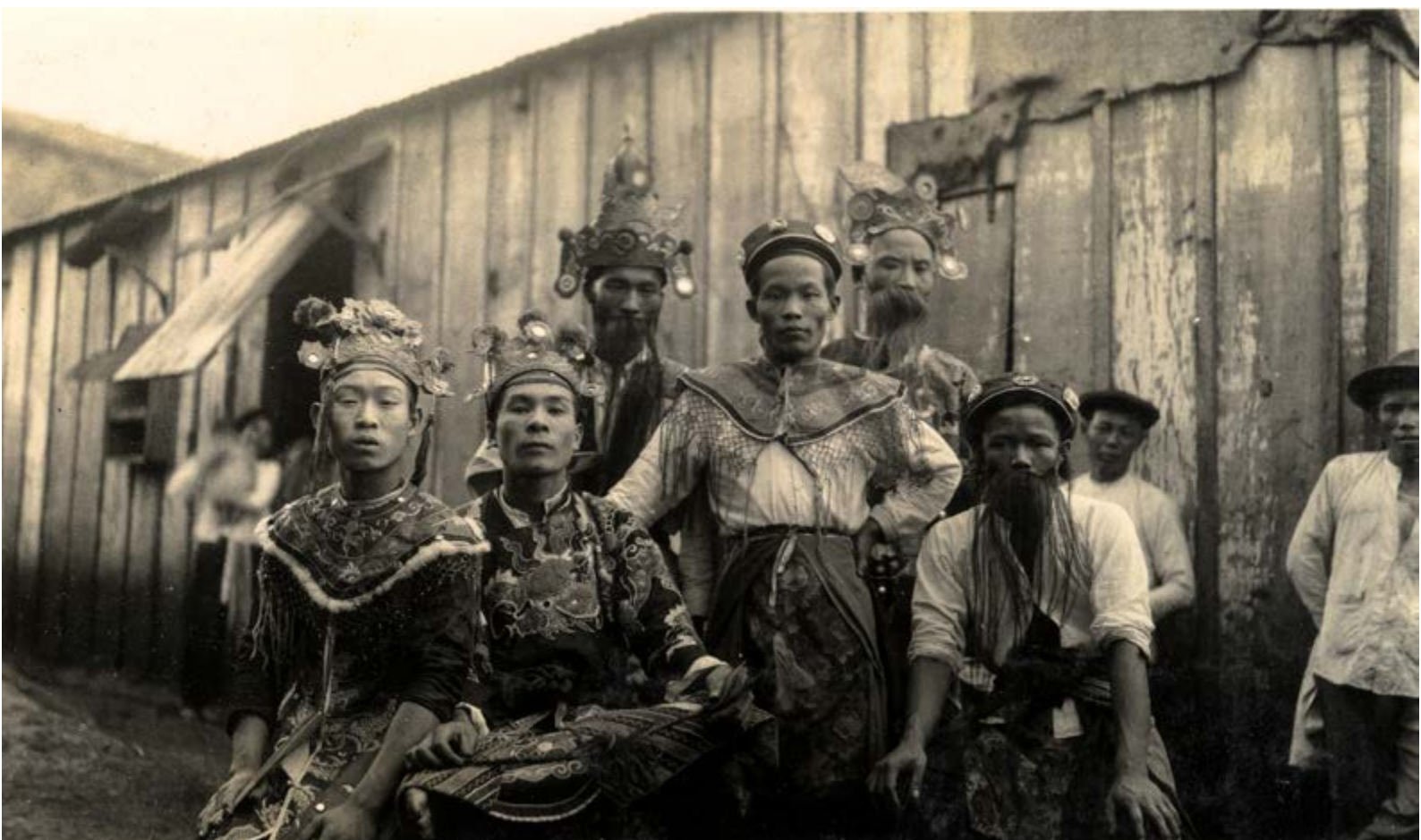
Fête vietnamienne sur un camp de mine, Nouvelle-Calédonie, c. 1940.